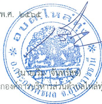
นายกองค์การบริหารส่วนตำบลไผ่หลวง

ประกาศ ณ วันที่ ๓๐ เดือนกันยายน พ.ศ. ๒๕๖๕